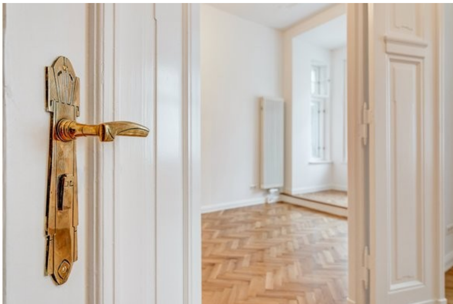
BBI - Shooting 10.03.2020 # - 043