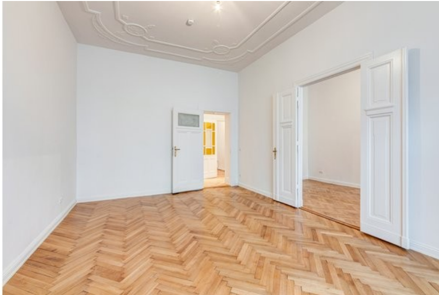
BBI - Shooting 10.03.2020 # - 008