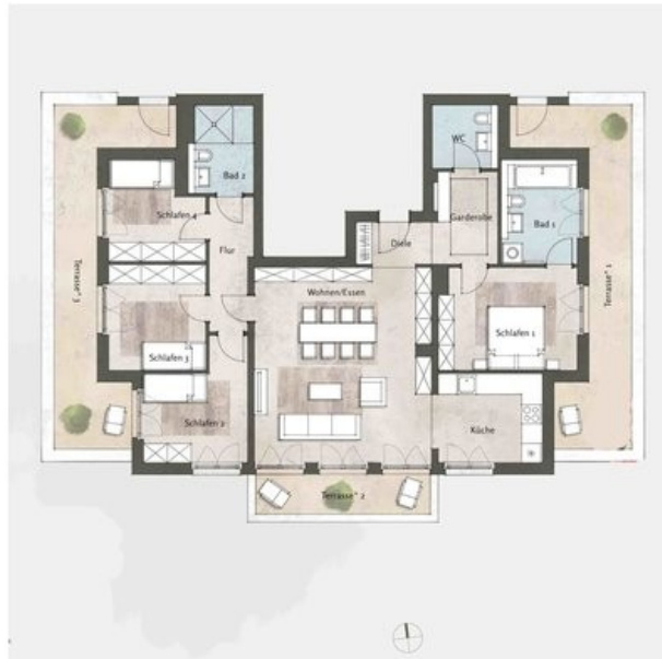
Haus 5, WE 81