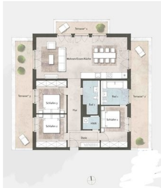
ausgewählter Beispielgrundriss Haus 1, WE 14