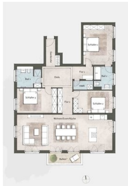
ausgewählter Beispielgrundriss Haus 2, WE 25