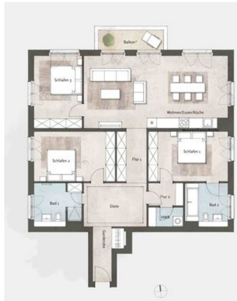
ausgewählter Beispielgrundriss Haus 3, WE 38