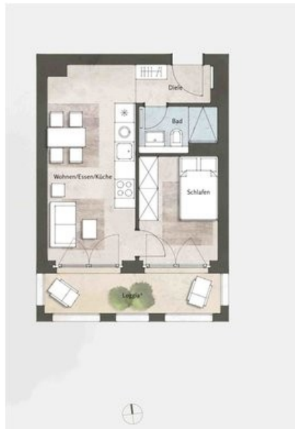
Beispielgrundriss Haus 5, WE76, 2 Zi.