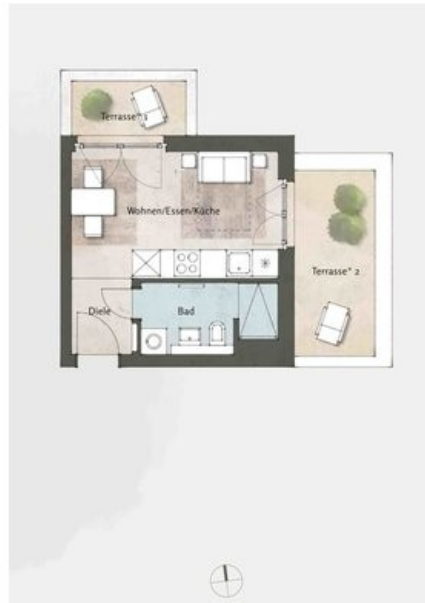
Beispielgrundriss Haus 5, WE 79, 1 Zi.