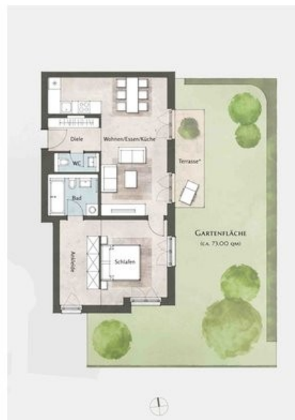
Beispielgrundriss Haus 4, WE 43, 2 Zi.