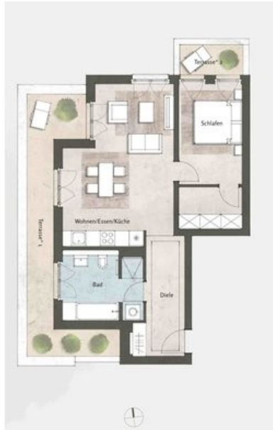
Beispielgrundriss Haus 4, WE 56, 2 Zi.