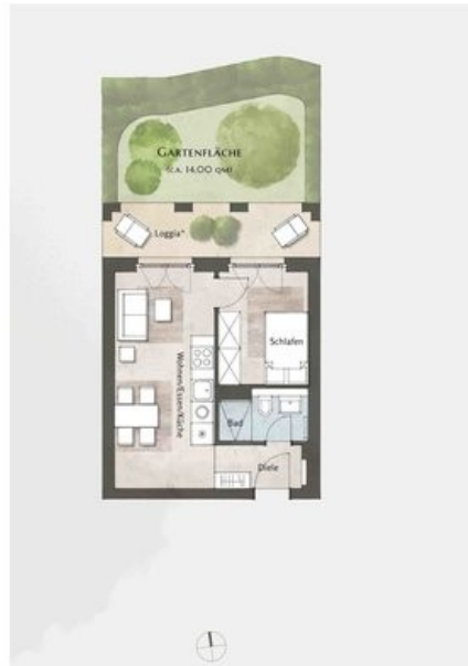
Beispielgrundriss Haus 4, WE 41, 2 Zi.