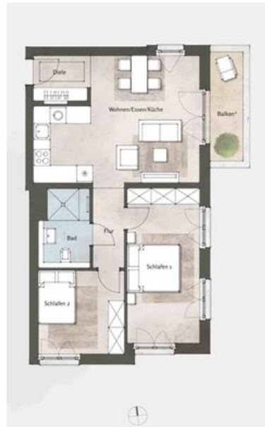
Haus 5, WE 68