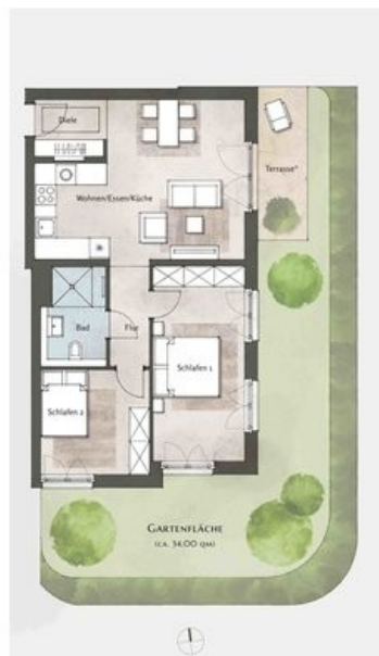
Beispielgrundriss Haus 5, WE 62