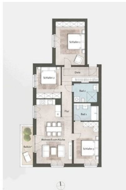
Beispielgrundriss Haus 3, WE 31