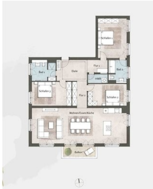
Beispielgrundriss Haus 2, WE 19