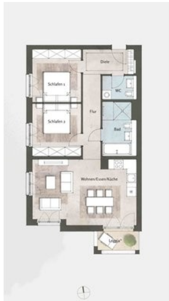
Beispielgrundriss Haus 4, WE 47