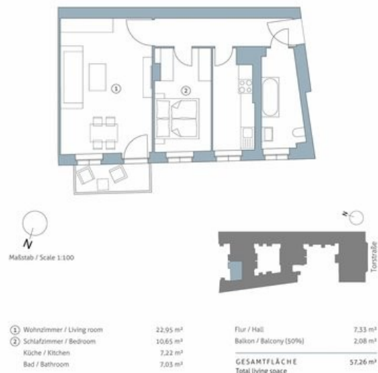
WE 54, 2. OG mi li, 2 Zi