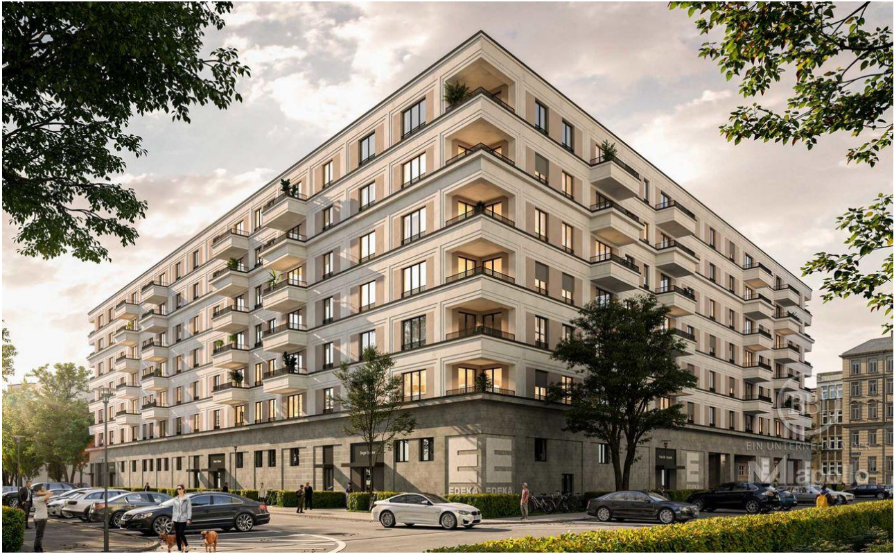
Visualisierung (1) Titel