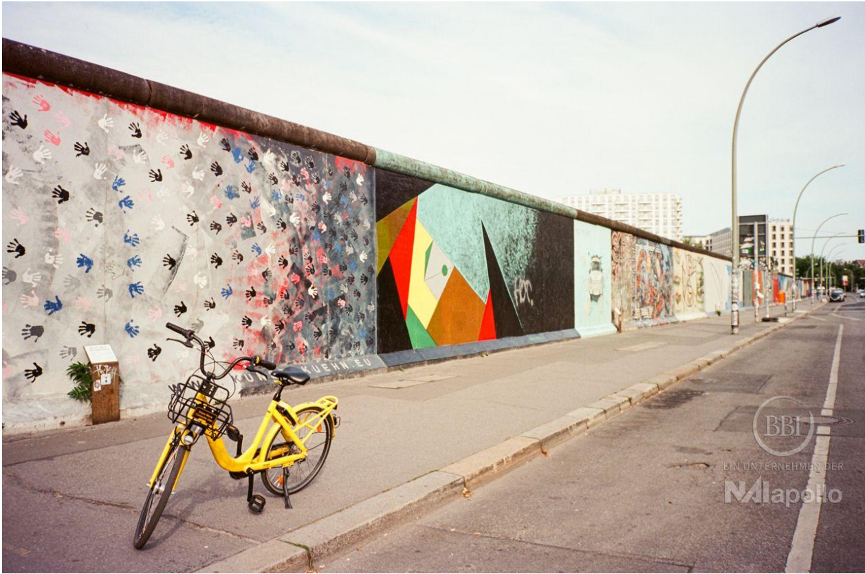
east side gallery