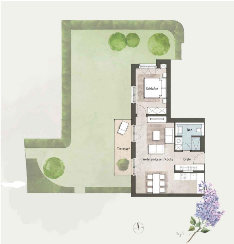
Haus 1, WE 4