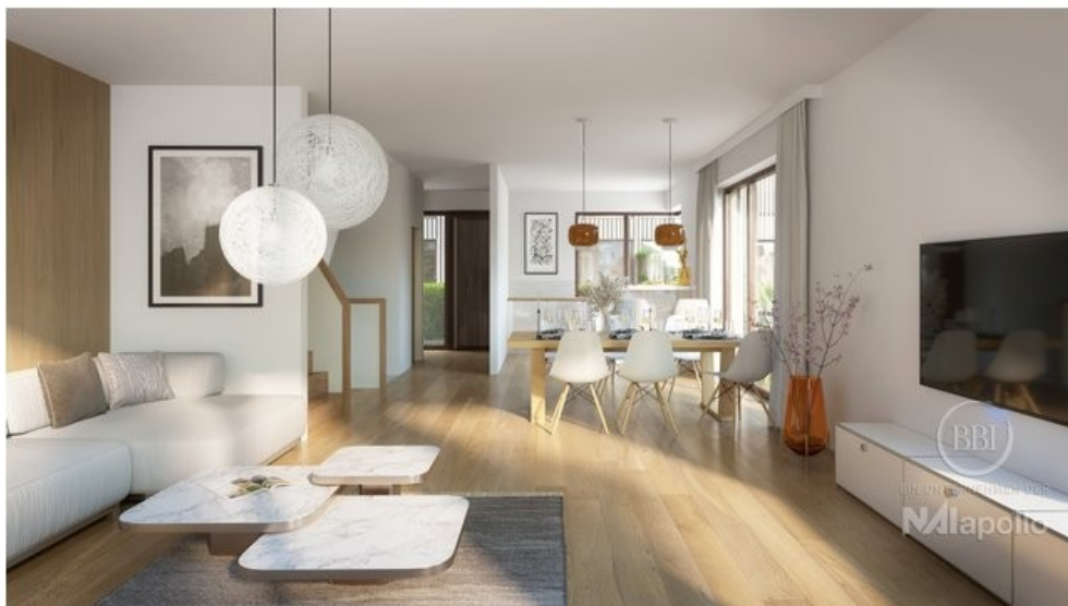
WOHNEN | FINAL