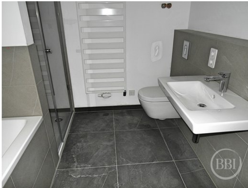
Bautenstand 12_7_2019 (14)