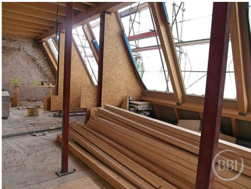
Bautenstand 12_7_2019 (27)