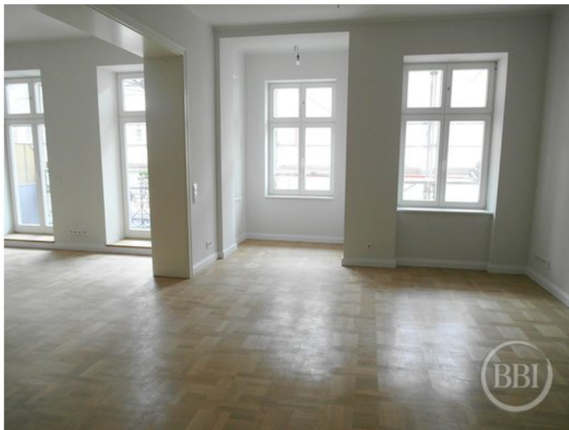
Bautenstand 12_7_2019 (8)