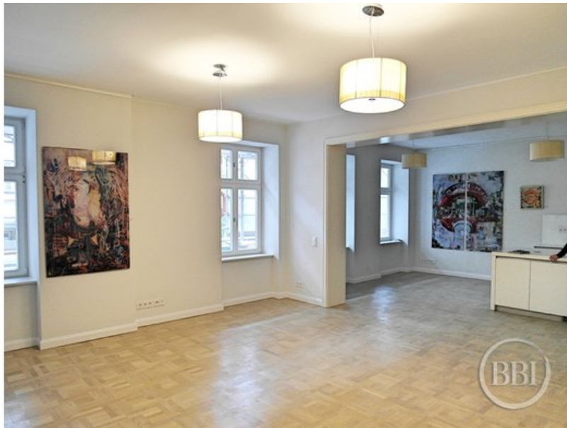
Bautenstand 12_7_2019 (46)