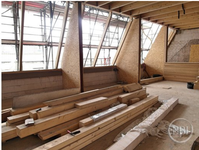
Bautenstand 12_7_2019 (22)