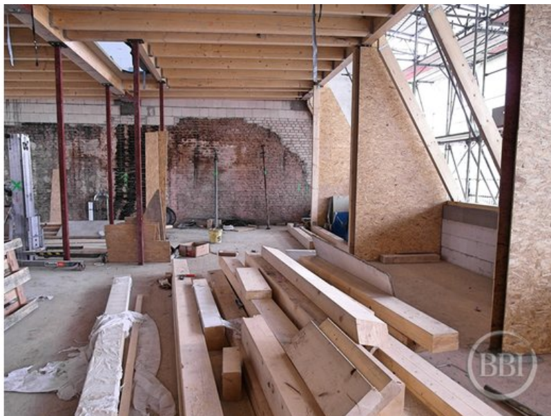
Bautenstand 12_7_2019 (19)