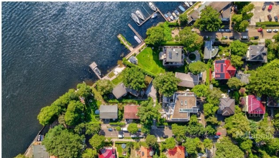
Luftbild Drone (3)