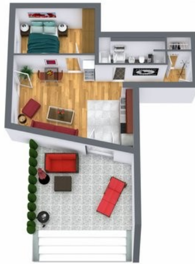
GRUNDRISS WE 3