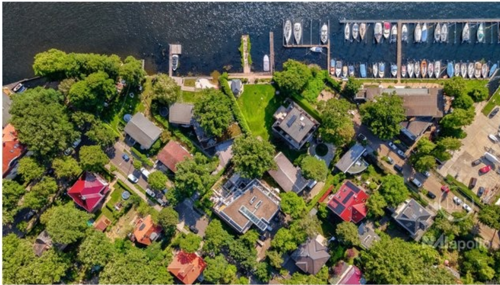
Luftbild Drone (4)