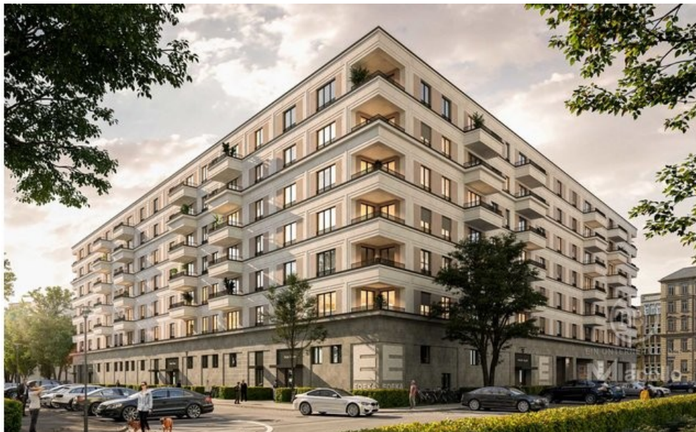
Visualisierung (1) Titel