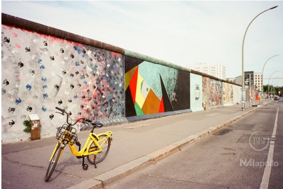
east side gallery