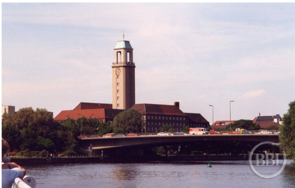
Blick zum Rathaus Spandau