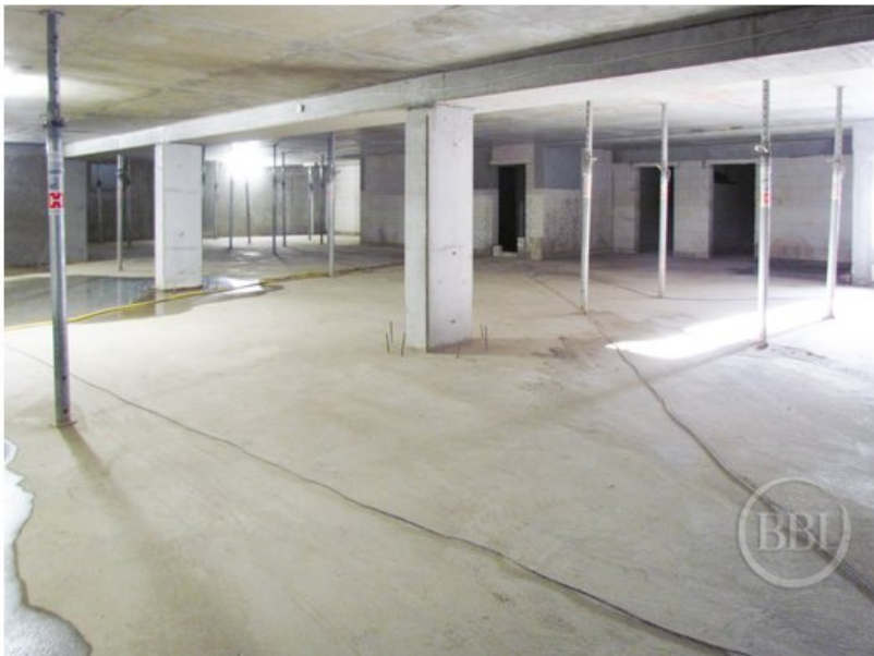
Bautenstand Sept2019 (68)