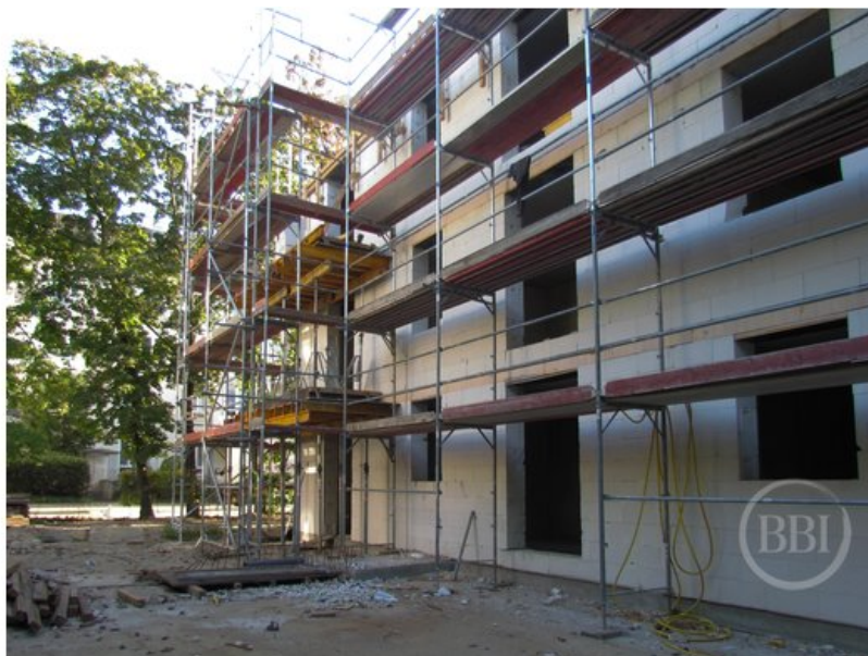
Bautenstand Sept2019 (10)