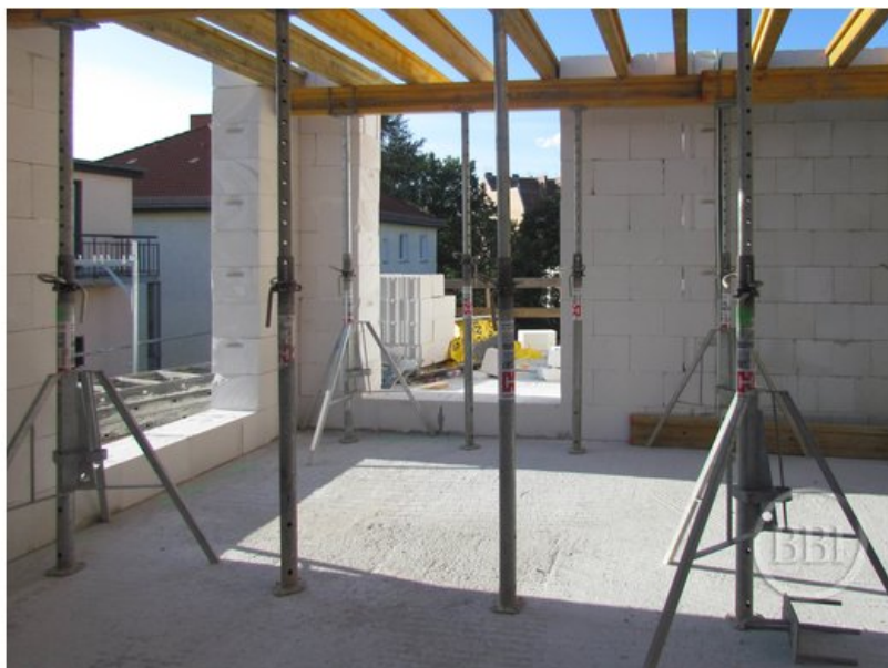
Bautenstand Sept2019 (51)