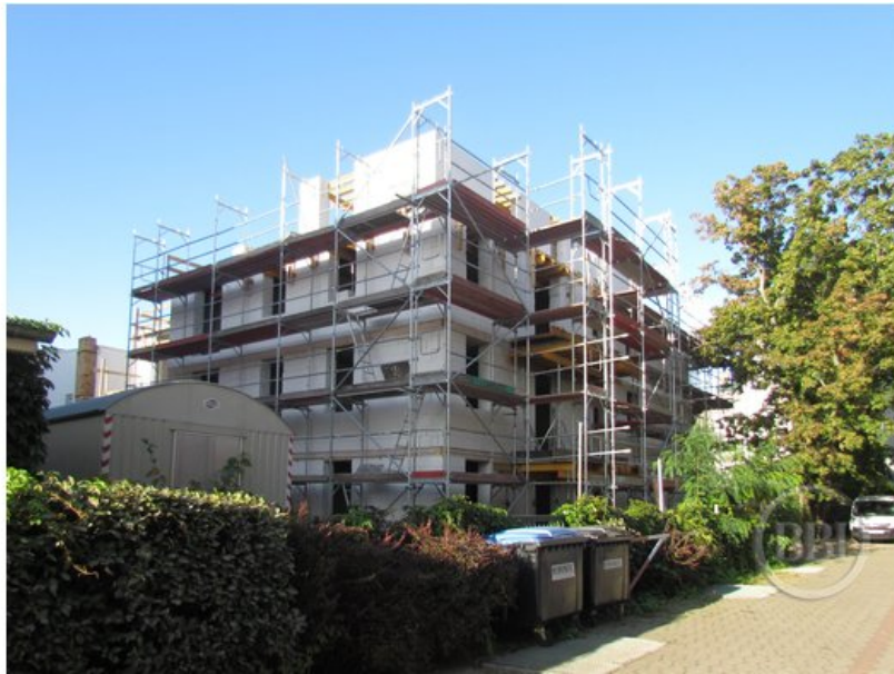
Bautenstand Sept2019 (4)