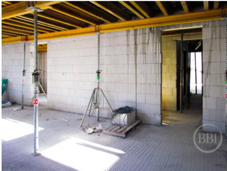
Bautenstand Sept2019 (34)