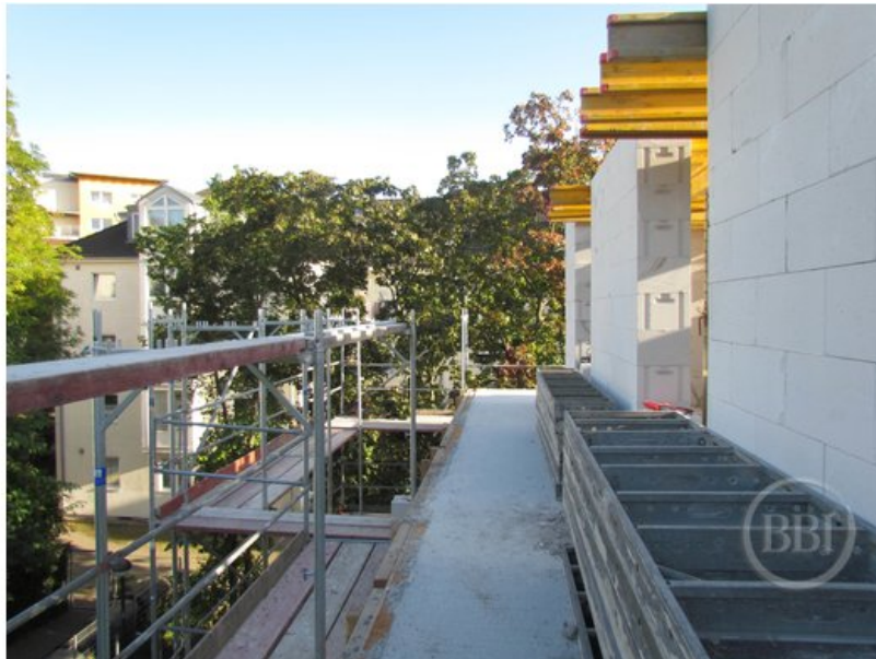
Bautenstand Sept2019 (45)