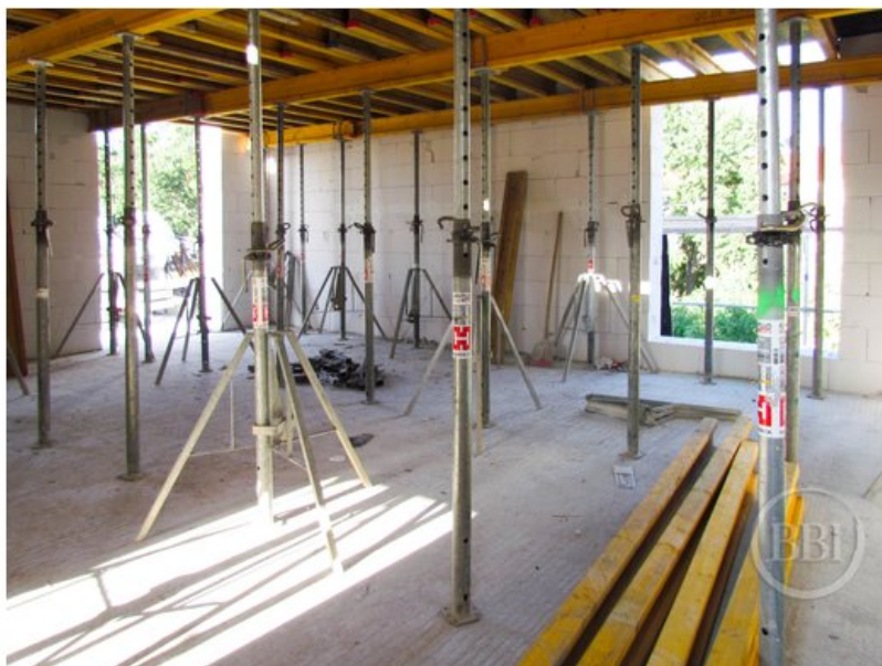
Bautenstand Sept2019 (37)