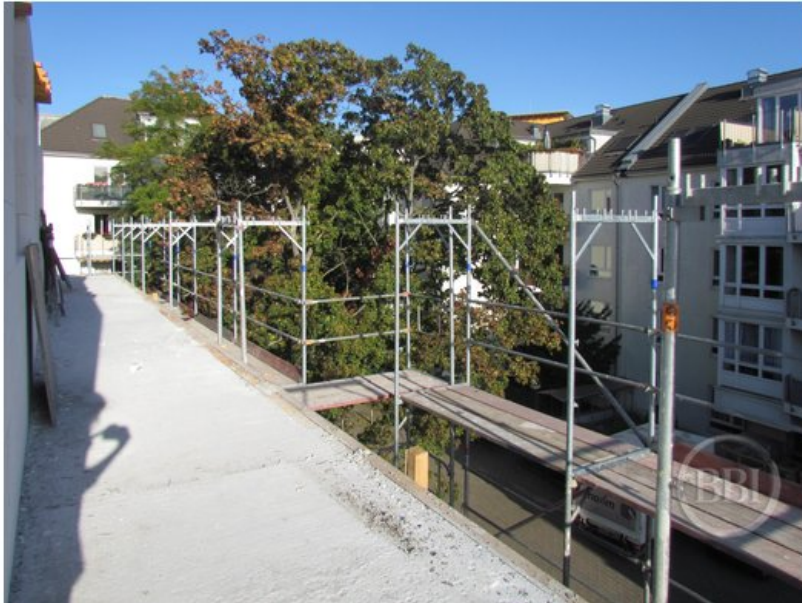
Bautenstand Sept2019 (54)