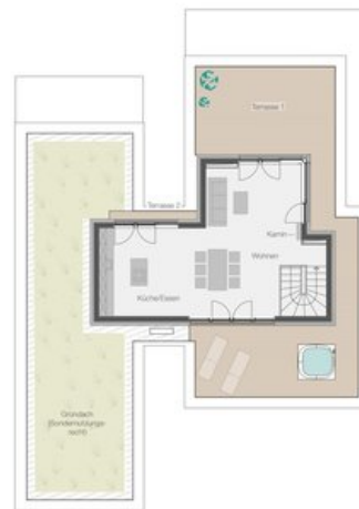
WE 3 - Penthouse-Maisonette