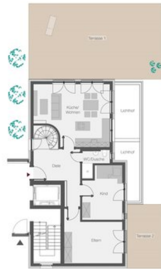
WE 2 - Gartenmaisonette