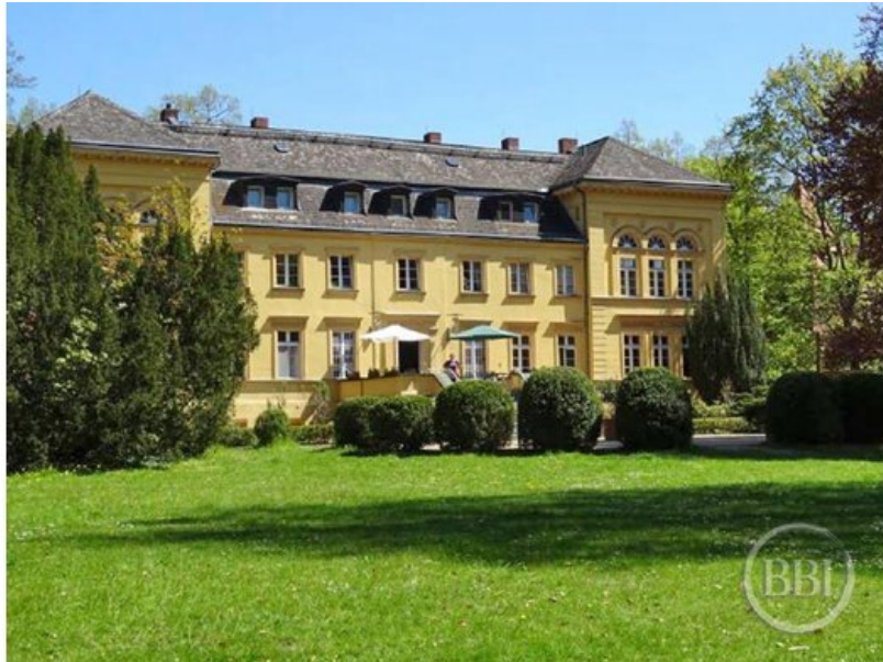
Sch losspark Lichterfelde