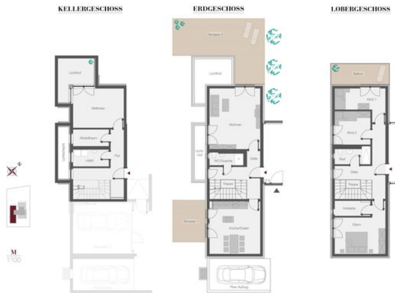
WE 1 - Townhouse