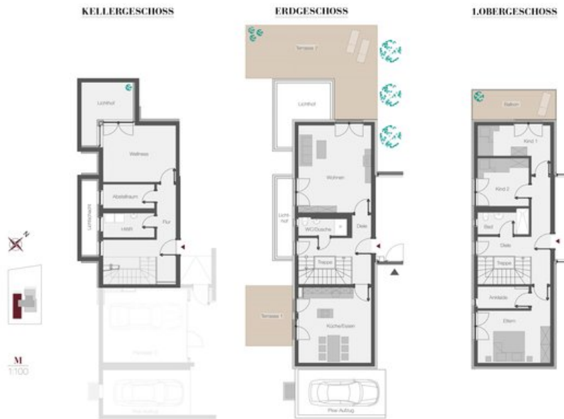
WE 1 - Townhouse