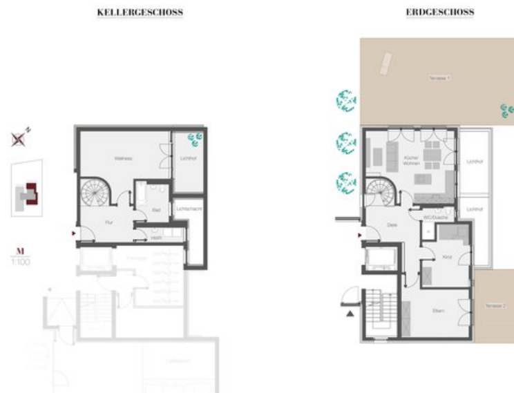
WE 2 - Gartenmaisonette