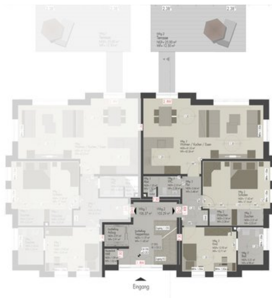
HAUS 12-13 EG_WE2