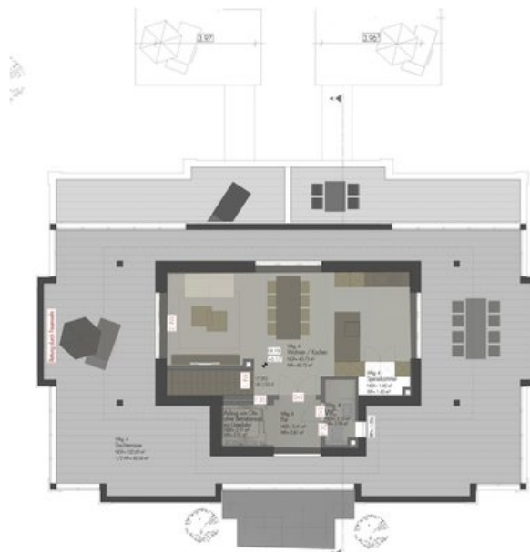
HAUS 12-13 DG-Maisonette_oben