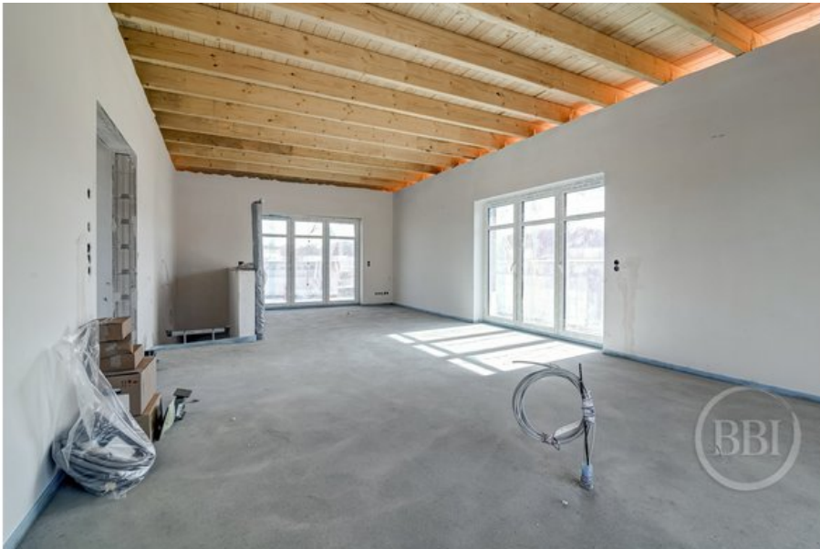
Referenzobjekt Apr19 (2)