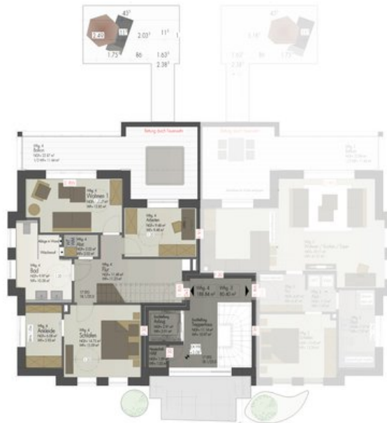
HAUS 12-13 DG-Maisonette_unten