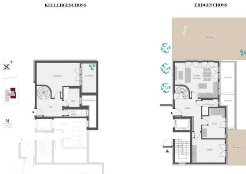
WE 2 - Gartenmaisonette