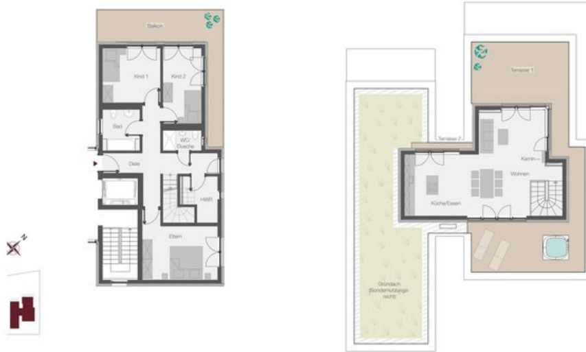
WE 3- Penthouse