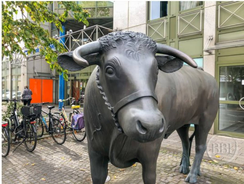
BBI Berlin Brandenburg Immobilien 25