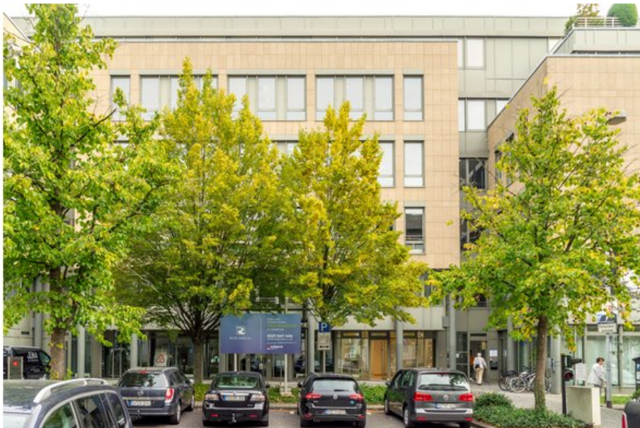
BBI Berlin Brandenburg Immobilien 3