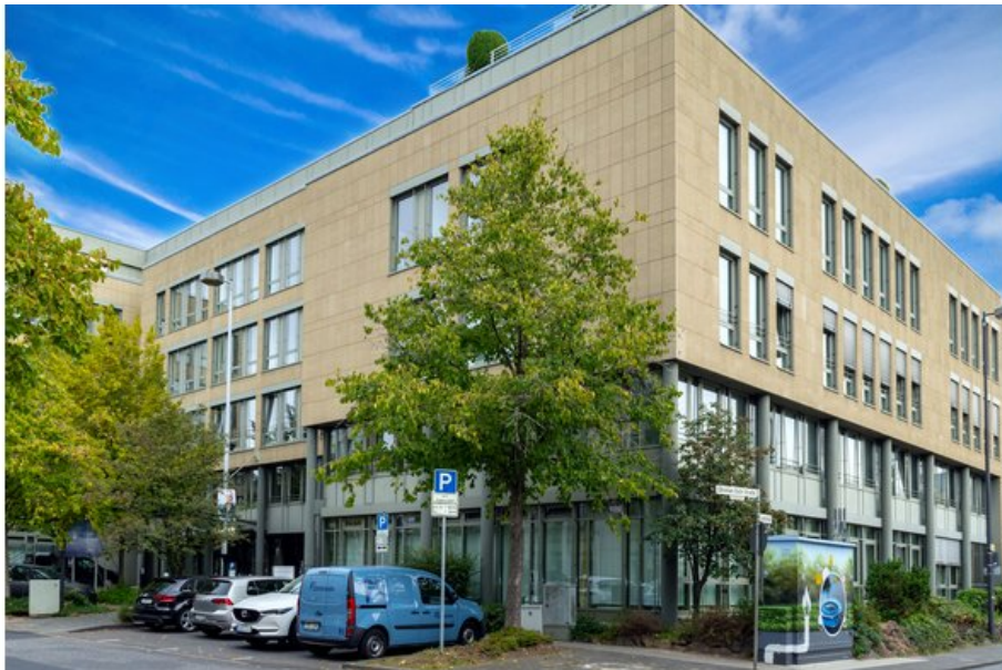
BBI Berlin Brandenburg Immobilien 4