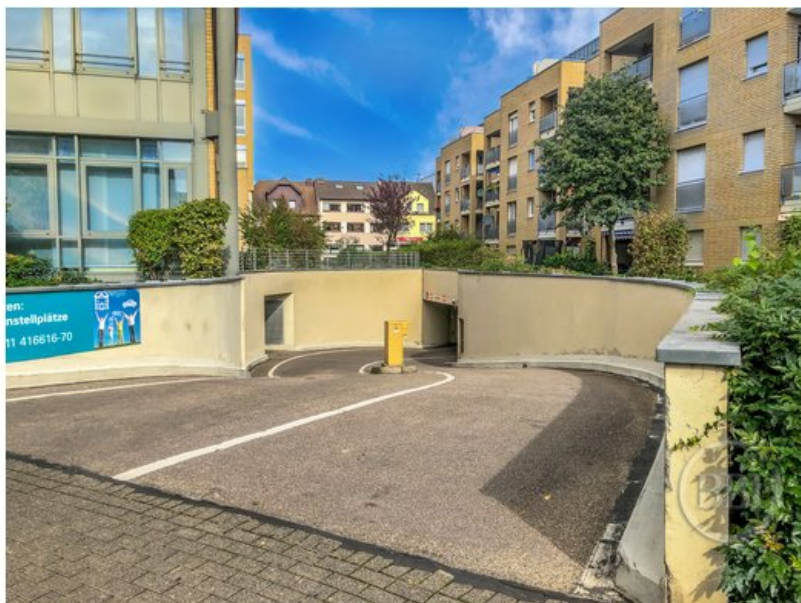
BBI Berlin Brandenburg Immobilien 13