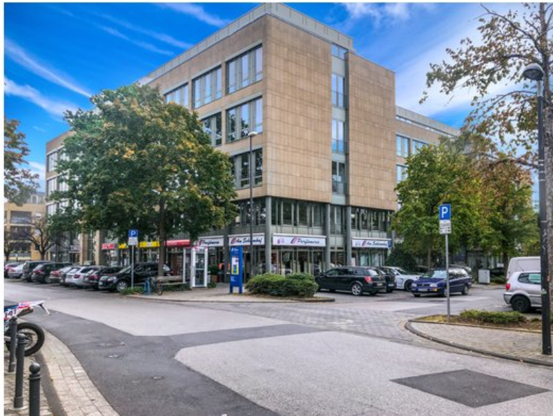
BBI Berlin Brandenburg Immobilien 7