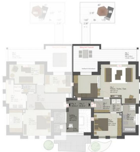
HAUS 12-13 OG_WE3