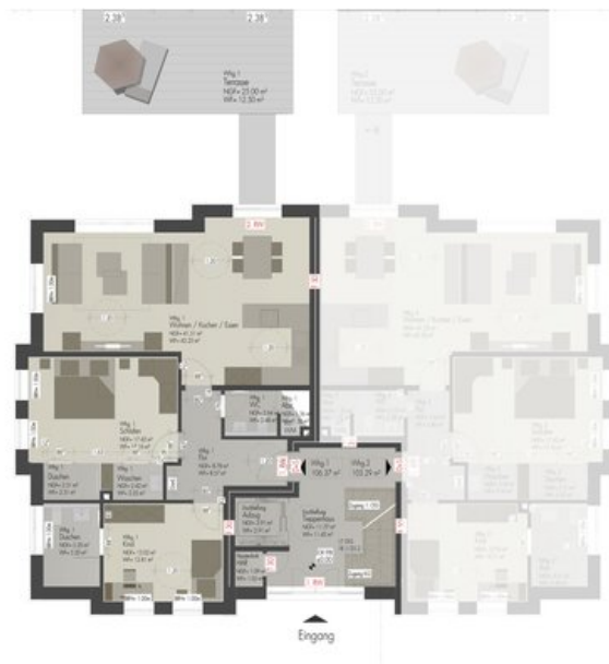
HAUS 12-13 EG_WE1