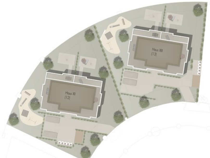
Aussenanlagen Haus XII-XIII